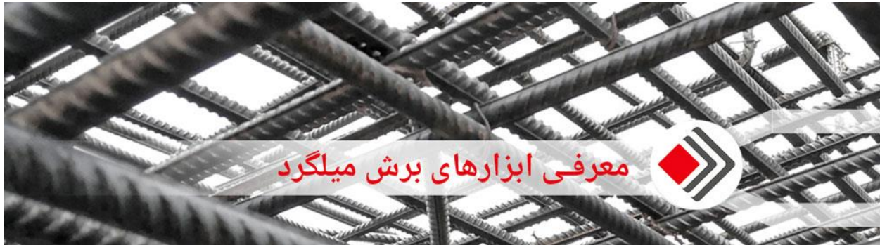
روش های برش میلگرد

این محصول را به دو روش می توان برش داد که شامل روش سرد و روش گرم است.